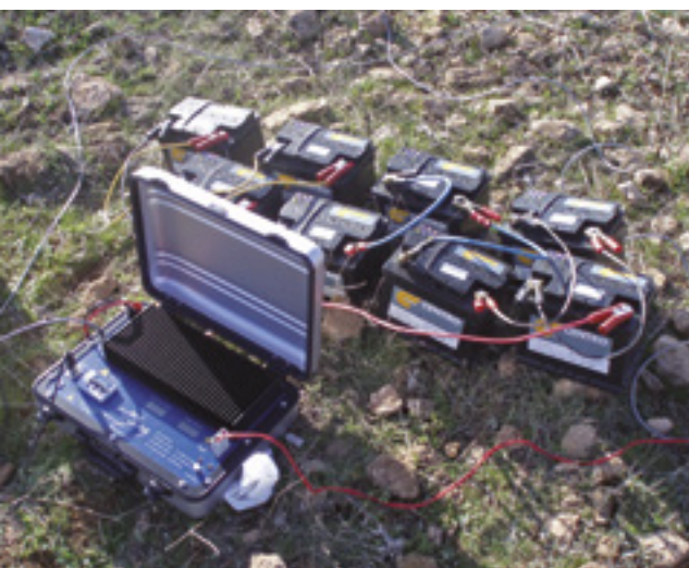
Equipo Transmisor SEDT (TerraTx-50).

Se realizó un sondeo de 300 metros obteniendo un caudal de 100 L/s. No obstante, la unidad permeable (en azul) llega hasta los 400 metros, por lo tanto, se podría haber realizado un sondeo más profundo y obtener un mayor caudal, pero 100 L/s cumplía sobradamente las necesidades de la finca.